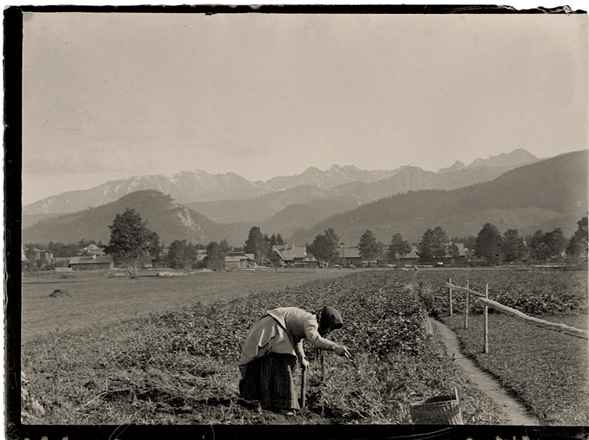
Góry, kobieta kopie grule, 11 X 1904

obejmującej ponad trzysta szklanych negatywów o wymiarach 4 × 6,5 cm. Wybrane na ekspozycję odbitki ponad stu z nich dokumentują dawne Zakopane, Tatry i związanych z nimi ludzi. Fotografie wykonane zostały w latach 1897–1905. Można podziwiać na nich surowe piękno gór, które Klementyna starała się uchwycić w różnych warunkach pogodowych. Uwieczniają drewnianą architekturę i górali: z zacięciem reporterskim i etnograficzną wrażliwością Klementyna „przyłapywała” ich w trakcie codziennych zajęć oraz przy świątecznych okazjach. Wśród fotografii znalazły się również portrety bywających w Zakopanem znakomitych przedstawicieli świata kultury np. brata Alberta Chmielowskiego, Henryka Sienkiewicza i Witkiewiczów.