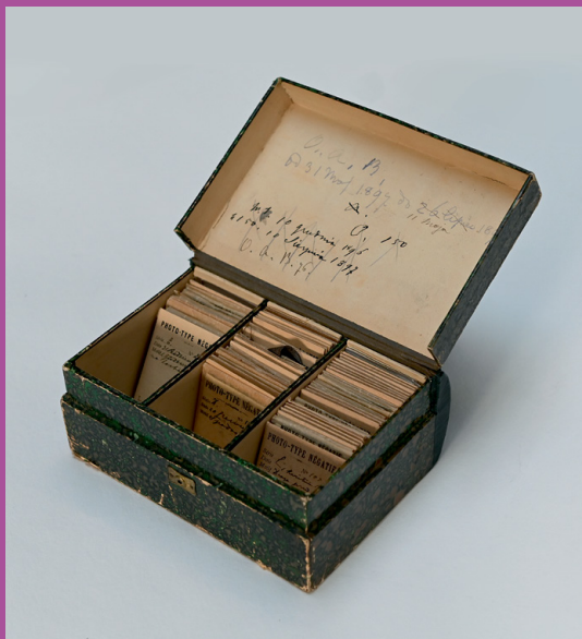
Profesjonalna skrzyneczka o wymiarach 13 × 17,5 × 7 cm do przechowywania negatywów wykonana przez firmę Comptoir Général de la Photographie, 57 Rue Saint-Roch Paris