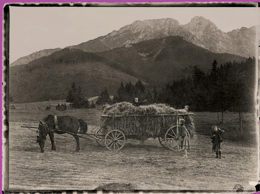
Fura, Giewont, sierpień 1904 r.